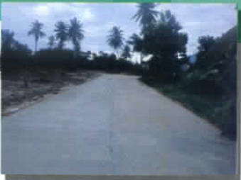
ปรับปรุงถนนผิวจราจร คสล.