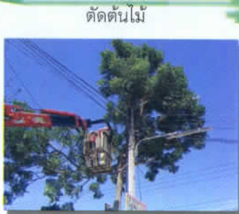
ตัดต้นไม้