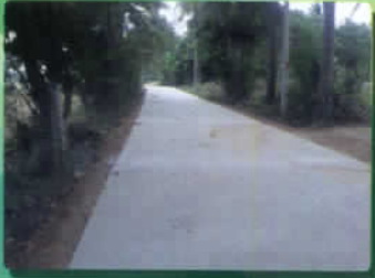
ปรับปรุงถนนผิวจราจร คสล. ม.๑