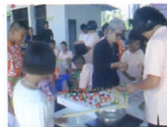
ทำขนมลูกชุบ