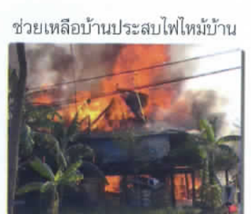
ช่วยเหลือบ้านประสบไฟไหม้บ้าน