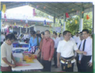
ต้อนรับคณะทูตลาว