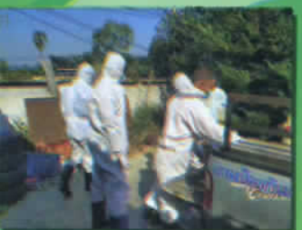
พ่นยาฆ่าเชื้อ