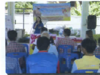
อบรมมะเร็งเต้านม