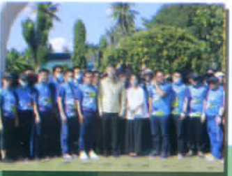
กิจกรรมเดิน-วิ่ง ๒๐๒๐