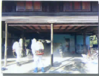
พ่นยาฆ่าเชื้อ