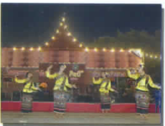
รักษาสานศิลป์