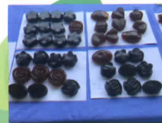
ทำสบู่หอม