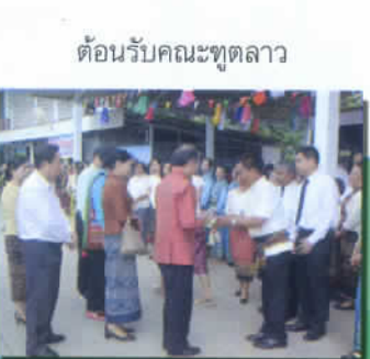
ต้อนรับคณะทูตลาว