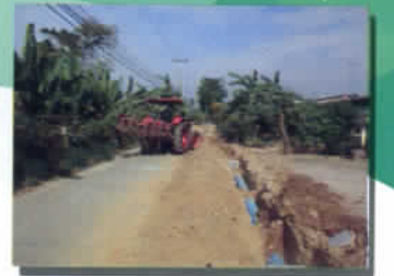
ฝังท่อระบายน้ำพร้อมบ่อพัก ม.๔