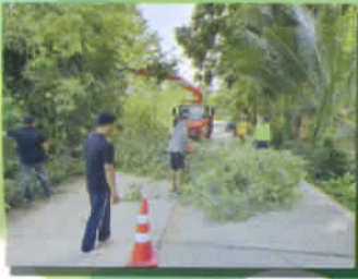
ช่วยเหลือตัดต้นไม้