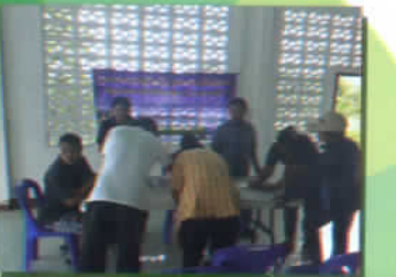
ตรวจสอบสุขภาพเคลื่อนที่