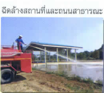
ฉีดล้างสถานที่และถนนสาธารณะ