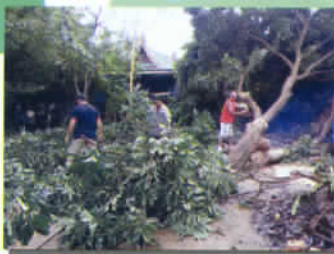
ตัดต้นไม้โค่นล้ม