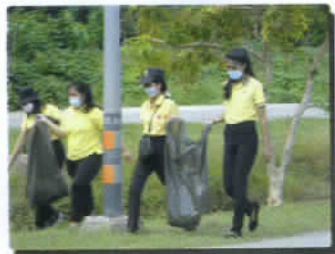
จิตอาสาตำบลมาบปลาเค้า