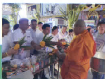
ตักบาตรเพ็ญเดือน ๓