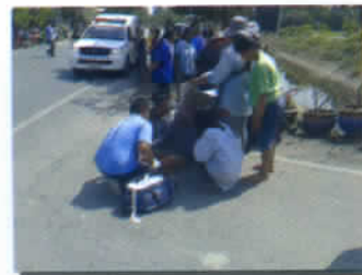
ช่วยเหลือผู้ประสบอุบัติเหตุ