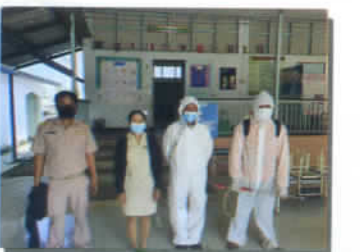
พ่นยาฆ่าเชื้อ COVID-19