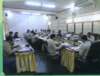
ประชุมสภา อบต.