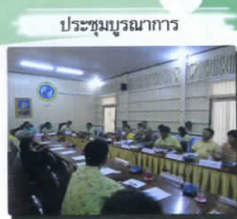
ประชุมบูรณาการ