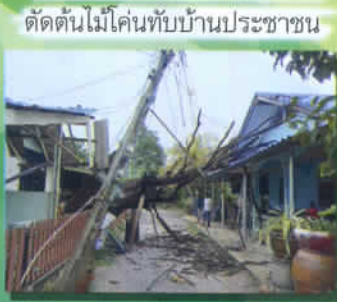
ตัดต้นไม้โค่นทับบ้านประชาชน