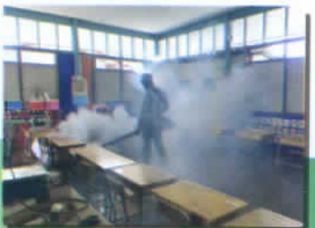
พ่นหมอกควัน