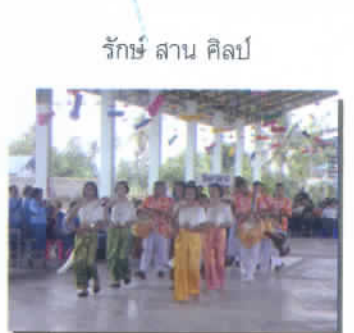
รักษาสานศิลป์