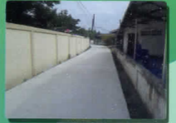
ปรับปรุงถนนผิวจราจร คสล. ม.๓