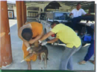
ฉีดวัคซีนป้องกันพิษสุนัขบ้า