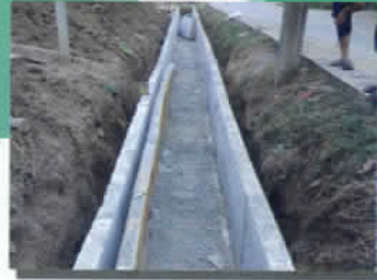
ปรับปรุงเหมือง คสล. ม.๕