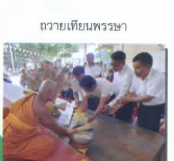
ถวายเทียนพรรษา