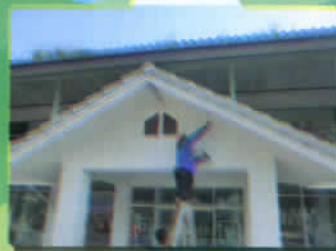
ปรับปรุงสำนักงาน อบต.