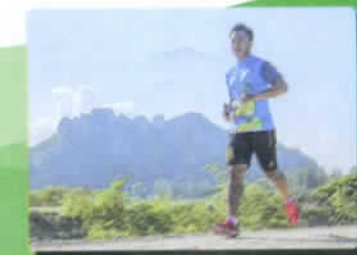
กิจกรรมเดิน - วิ่ง Mapplakkhao Run @ Fun 2020

พบเห็นการทุจริต หรือมีเรื่องร้องเรียน โปรดแจ้ง ๐๓๒ ๕๐๖ ๒๐๐ ต่อ ๑๔ หรือ ๑๑ สำนักปลัดองค์การบริหารส่วนตำบลมาบปลาเค้า ๐๓๒ ๕๐๖ ๒๐๐ ต่อ ๑๑