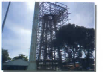
ก่อสร้างประปา ม.๖