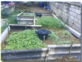
ปลูกผักปลอดสารพิษ