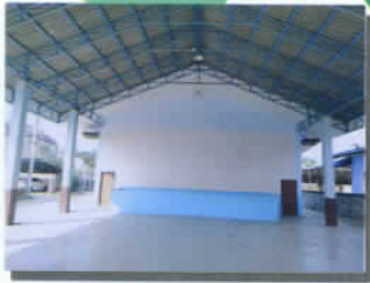
ปรับปรุงอาคารไทยพวน ม.๓