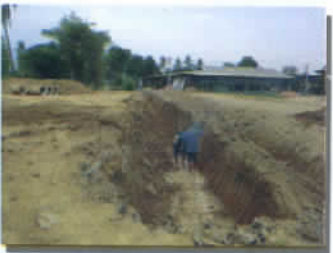
ฝังท่อ คสล. ม.๘