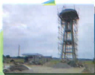
ก่อสร้างระบบประปา ม.๘