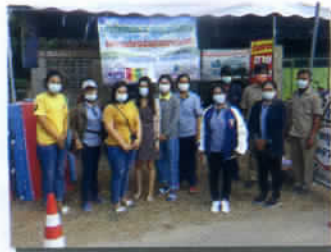
ด้านชุมชนเทศบาลปีใหม่