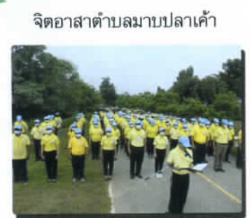
จิตอาสาตำบลมาบปลาเค้า