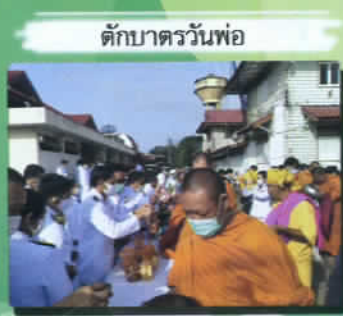
ตักบาตรวันพ้อ