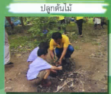
ปลูกต้นไม้