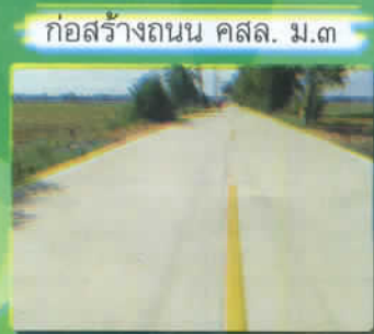
ก่อสร้างถนน คสล. ม.๓