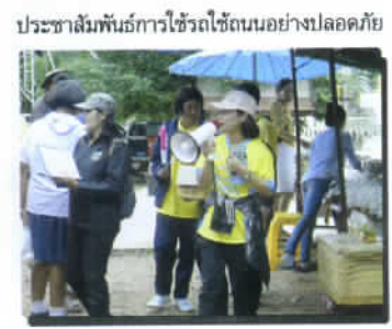
ประชาสัมพันธ์การใช้รถใช้ถนนอย่างปลอดภัย