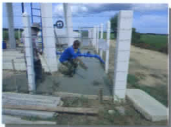
เทคอนกรีตเสริมเหล็กพื้นที่รอบ ประปาหมู่บ้าน