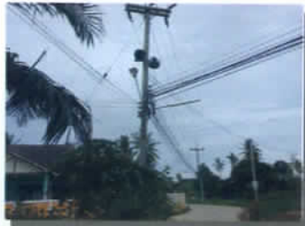
ปรับปรุงท่อกระจายข่าว ม.๗