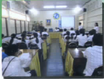
อบรมจริยธรรม