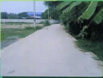
ปรับปรุงถนนผิวจราจร คสล.