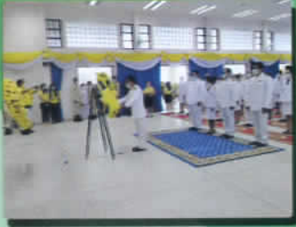
ทำพิธีวางพวงมาลา