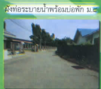
ฝังท่อระบายน้ำพร้อมบ่อพัก ม.๘