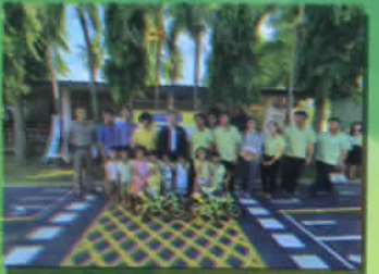
ศูนย์การเรียนรู้ด้านการจราจร