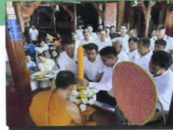
กิจกรรมถวายเทียนเข้าพรรษา