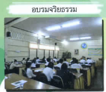
อบรมจริยธรรม