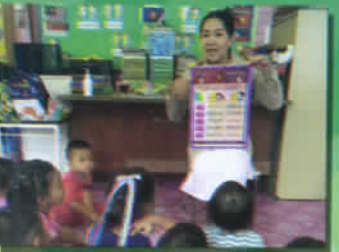
ให้ความรู้เกี่ยวกับ COVID-19