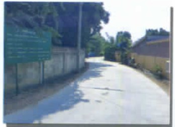
ซ่อมผิวจราจร คสล. ม.๒