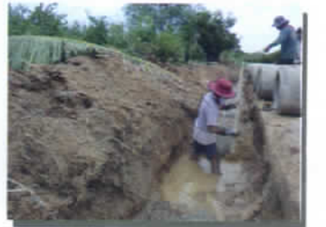
ฝังท่อระบายน้ำ คสล. ม.๖