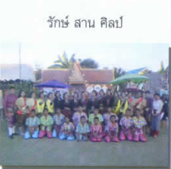
รักษาสานศิลป์