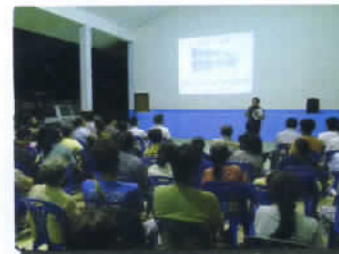
ประชามหมู่บ้าน