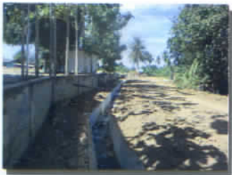
ปรับปรุงเหมืองดินเป็น คสล. ม.๑๑