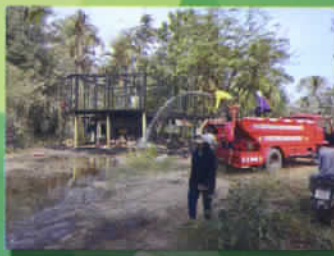
ช่วยเหลือบ้านไฟไหม้