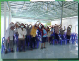
เสริมสร้างสุขภาพผู้สูงอายุ