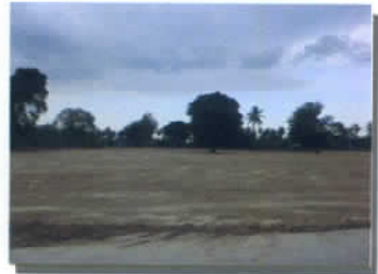
ปรับปรุงพื้นที่ดินของอบต.มาบปลาเค้า