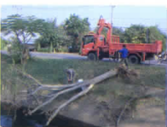
ตัดต้นไม้โค่นล้ม