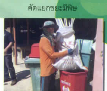
คัดแยกขยะมีพิษ