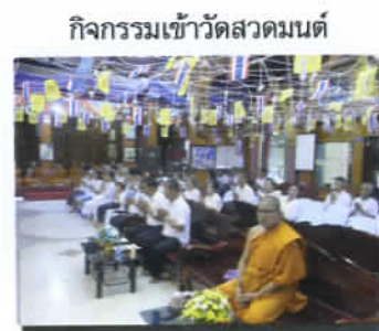
กิจกรรมเข้าวัดสวดมนต์