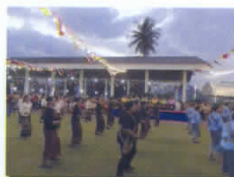
รักษาสานศิลป์