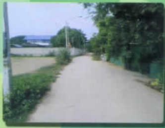
ปรับปรุงถนนผิวจราจร คสล. ม.๒