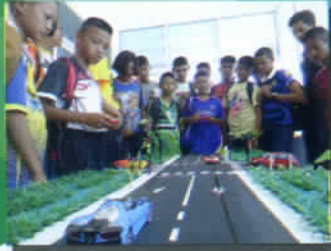
ส่งเสริมการจราจร